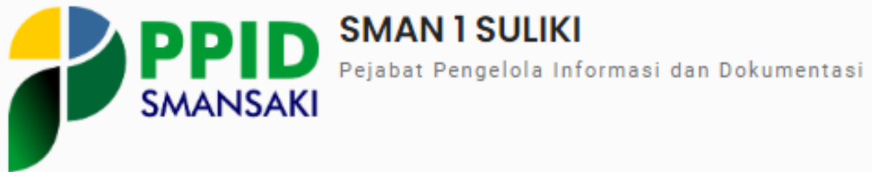
LOGO PPID SMAN 1 SULIKI